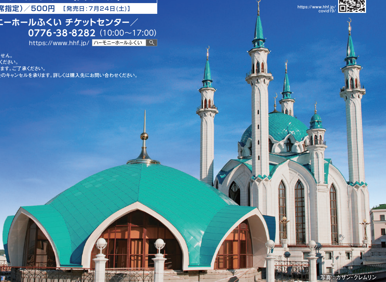
写真: カザン・クレムリン

主催: 公益社団法人 国際音楽交流協会 ( http://www.imea.or.jp/ ) 本願寺 井村屋グループ株式会社 ダイキン工業株式会社 大阪ガス株式会社 影近設備工業株式会社 株式会社大原の里