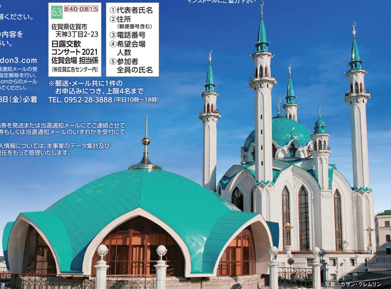
写真: カザン・クレムリン

■ 主催: 公益社団法人 国際音楽交流協会 (http://www.imea.or.jp/) 本願寺 井村屋グループ株式会社 ダイキン工業株式会社 大阪ガス株式会社 影近設備工業株式会社 株式会社大原の里