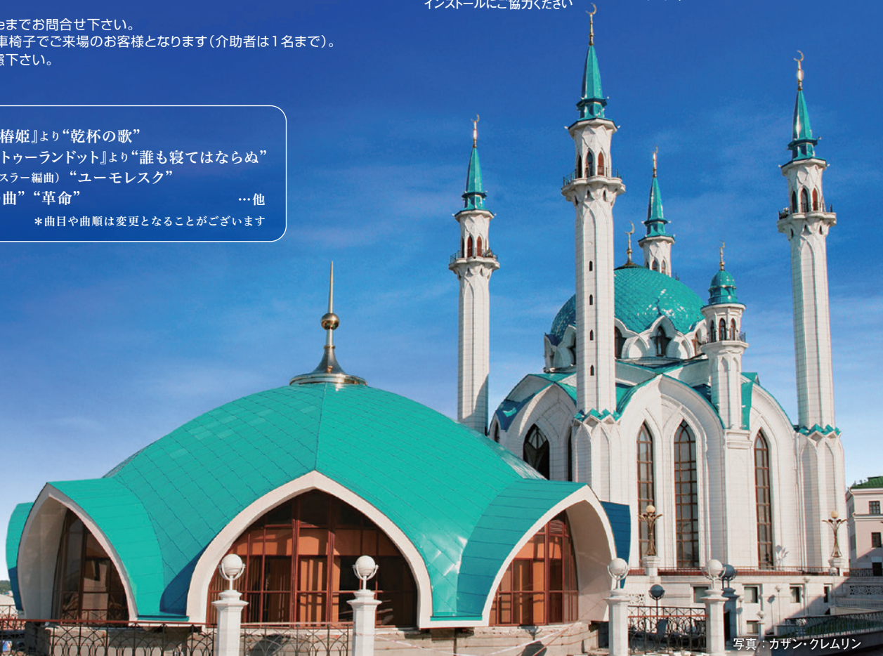
写真：カザン・クレムリン

主催：公益社団法人 国際音楽交流協会 ( http://www.imea.or.jp/ ) 本願寺 井村屋グループ株式会社 ダイキン工業株式会社 大阪ガス株式会社 影近設備工業株式会社 株式会社大原の里