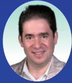
レオニード・ボムシュテイン Леонид Бомштейн