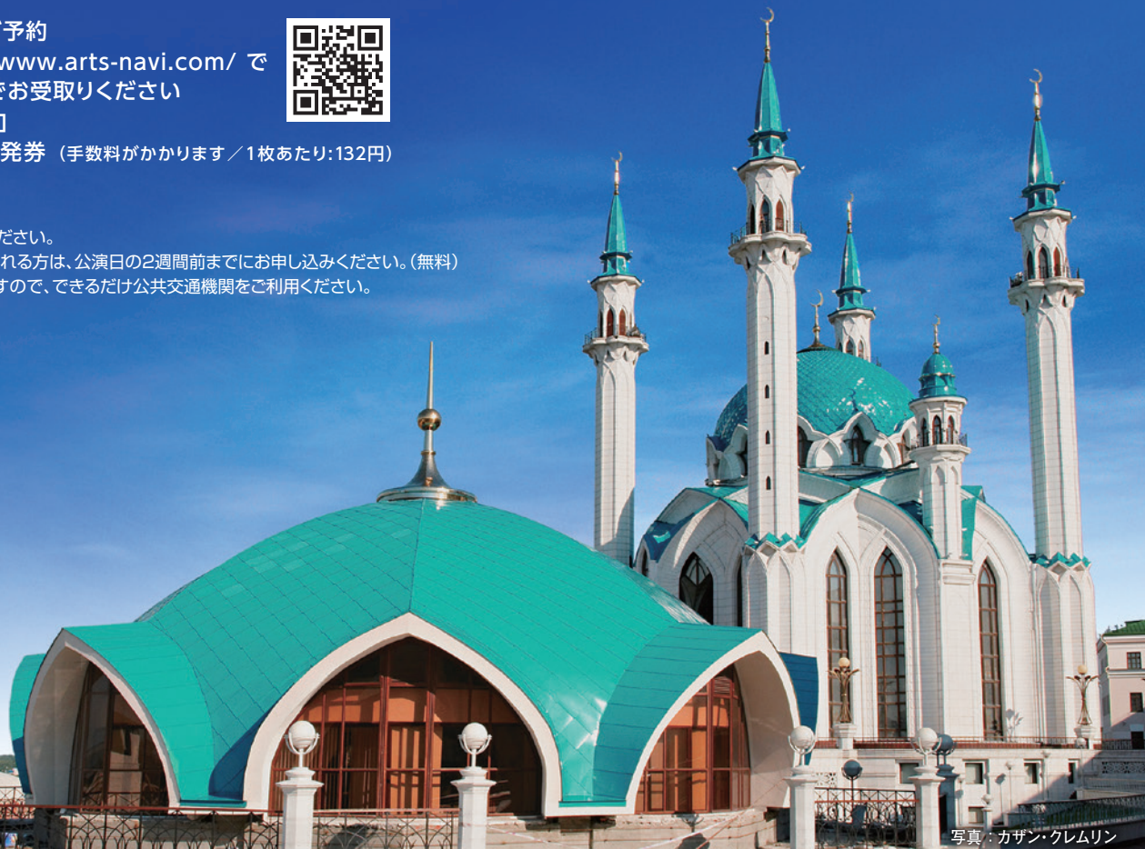
写真：カザン・クレムリン

主催：公益社団法人 国際音楽交流協会 ( http://www.imea.or.jp/ ) 本願寺 井村屋グループ株式会社 ダイキン工業株式会社 大阪ガス株式会社 影近設備工業株式会社 株式会社大原の里