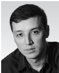
オイベク・イマモフ (チェロ) Oybek Imamov

モスクワに生まれる。モスクワ音楽院アカデミック音楽カレッジを経て、グネーシン記念音楽アカデミーでフズネツォワ氏に師事した。ミュージック・ウィズアウト・リミッツ(2013、リトアニア共和国)第1位入賞、ミュージカル・パフォーマンス・アンド・ペダゴギー(2014、イタリア)第1位入賞等、数々の国際コンクールでの入賞歴を持つ。2011年からグネーシン劇場のオペラスタジオでソリストを務めた。現在、ロシア国内やカザフスタン、イタリア、フランス等で音楽フェスティバルへの参加やコンサート活動を精力的に行っている。また、2021年に「日本大好きスターシャ」としてYouTubeチャンネルを開設し、童謡、唱歌、都道府県歌、演歌、歌謡曲等、日本文化を広く発信している。